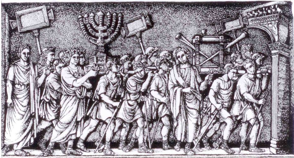
איור מס' 3: כלי המקדש נישאים בתהלכות ניצחון כפי שהונצחה בשער טיטוס שברומא (העתק מסוף המאה השבע-עשרה)

בכל שנה היו מכינים שתי פרוכות גדולות ומפוארות, שארוגות באופן מיוחד בחוטים הצבועים בחומרי גלם יקרים (תכלת, ארגמן ותולעת שני). וזו לשון המשנה: "ומשמונים רבוא נעשית ושתיים עושין בכל שנה ושלוש מאות כהנים מטבילין אותה" (שקלים פ"ח מ"ה). אין לקבל את הפירוש שמדובר במחיר של 82,000 דנר. 130 כבר העירו חז"ל שכל הנתונים המובאים בקשר לתיאור זה הם דברי "גוזמא" או "הבאי", 131 אך עדיין ברור שמדובר בהוצאה נכבדת, שכללה את עלות חומרי הגלם ואת שכר הנערות שעסקו באריגה והממונה עליהן. 132