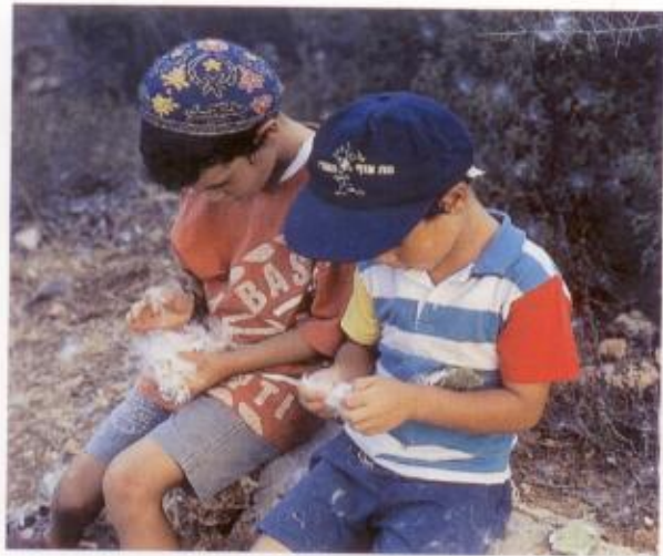
הפרדת סיבי פתילת המדבר מן הזרעים

פתילת המדבר הוא רק אחד מצמחי הבר הרבים הגדלים בארץ ישראל, אשר בתקופות קדומות הפיקו מהם מוצרים ייחודיים שברובם אינם ידועים עוד בימינו. על חלק מצמחים ומוצרים אלה אנו ממשיכים לעסוק כיום במחקר.