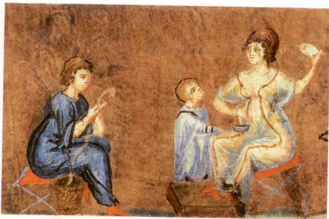
נשים טוות, "בראשית של וינה" (כתב-יד מאויר מן המאה השישית), Cod. theol. graec. 31, עמ' 31 (פרט; ראו הדף השלם להלן, עמוד 129) Österreichische Nationalbibliothek, Vienna

שבגדי הכוהנים בבית המקדש היו עשויים שעטנז, היינו צמר ופשתים (משנה כלאים ט, א). על כן שילוב מתאים יכול להיות אריג שחוטיו עשויים מצמר ומפתילת המדבר. שילוב אפשרי אחר הוא שילוב סיבי פתילת המדבר ופשתן, שני חומרי גלם צמחיים הדומים מאוד בתכונותיהם. אריג זה קיבל את יציבותו מסיבי הפשתן ואת הדרו ועידונו מסיבי פתילת המדבר. מכאן אולי ההסבר לכך, שה"בוץ" לפי חלק מן המקורות נכלל במשפחת הפשתה.