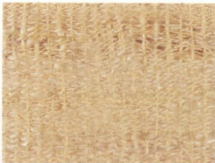
למחצה, וכן חוטי 'משי' ארוכים, יקרים מאוד לבדווים, השוזרים מהם פתילים לרובים התופיים שלהם".