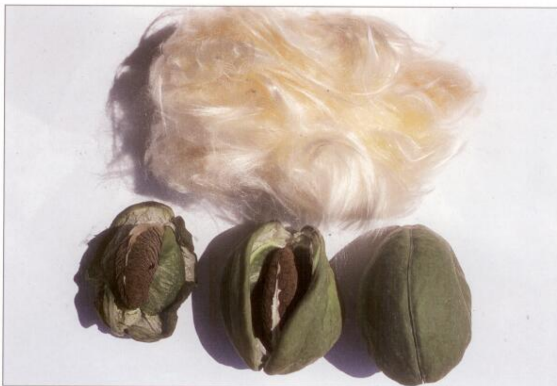
פירות פתילת המדבר (בשלבי פתיחה שונים) וצמר נקי שהופק מהם