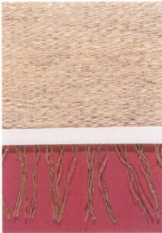
למעלה: חוטי שתי מפשתן למטה: חוטי ערב מפתילת המדבר

לפירוש התורה של רב סעדיה גאון ולאישיותו הדומיננטית בעולם ההלכה נודעה השפעה ניכרת על הפרשנות הרבנית, הקראית והשומרונית, כבר בימיו וכן בדורות מאוחרים לו. כך, למשל, אנו מוצאים את זיהוי המונח "בוץ" עם ה"עשר" בדברי הלקסיקוגרף הסורי בר'בהלול בן המאה העשירית וכן בתרגום התורה לערבית של השומרונים. יחד עם זאת ראוי לציין, שהצעתו של רס"ג לא התקבלה, והרוב המוחלט של הפוסקים והחוקרים תמימי דעה, שה"בוץ-שש" הוא מין של פשתה. דומה שדעתו של רס"ג לא זכתה לתשומת לב מספקת גם משום שאריגת בגדים מפתילת המדבר לא נודעה, וגם אינה נזכרת בספרות המדעית.